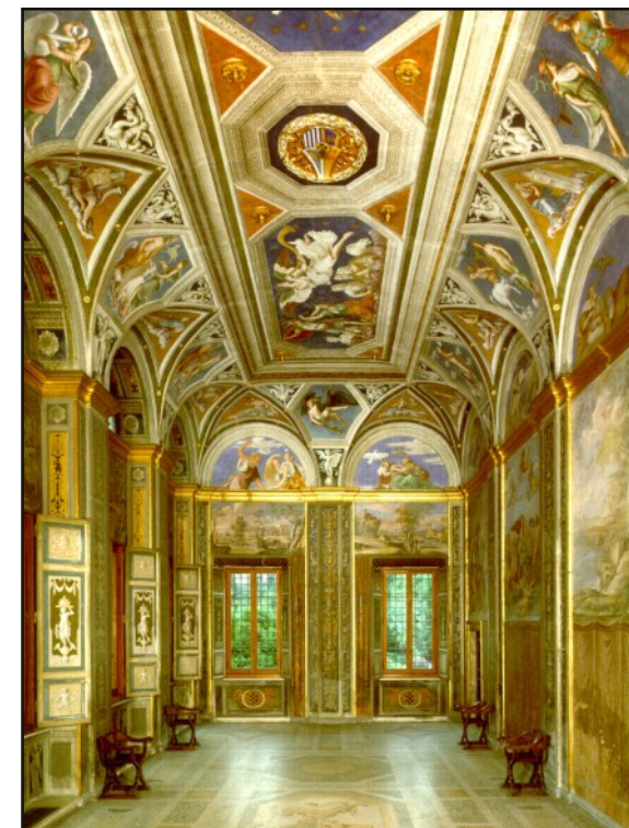
Sala di Galatea - Villa Farnesina, Roma